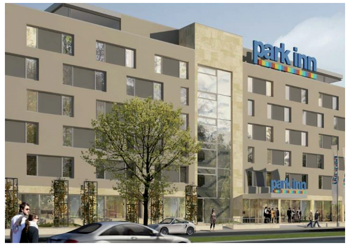
Fondsimmobilie Hotel Flughafen Frankfurt