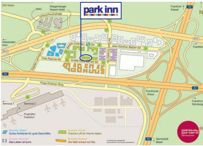
Standort Park Inn im Quartier Gateway Gardens